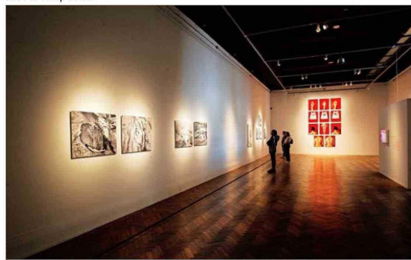
La artista exhibe en el MNBA registros de performances y también otras imágenes. En los años 70 llegó a la fotografía por casualidad y le fascinó.

con quien la autora editó un completo libro en tiempos de pandemia, incluye además fotografías y registros de performances . Es un recorrido que abarca cuatro décadas de un quehacer siempre vinculado al feminismo y al entorno natural. La artista establece cruces entre ambos temas. Y lo explica: "Mi interés por la naturaleza empieza prácticamente en el mismo momento en el que decido canalizar mi trabajo fotográfico a través de la mirada feminista y hacia el cuerpo. El permiso de despojarme de mi ropa en medio del paisaje tiene que ver con una perspectiva feminista, pe-